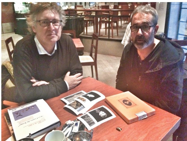
Michel Onfray et Richard Volante, janvier 2017

Michel Onfray est l'auteur de nombreux ouvrages où il développe une théorie de l'hédonisme. Il propose de réconcilier l'homme avec son corps, machine sensuelle, et de bâtir une éthique fondée sur l'esthétique. Pour lui, la philosophie est comme un art de vivre, de mieux vivre, qui permet de se débarrasser de ses illusions.