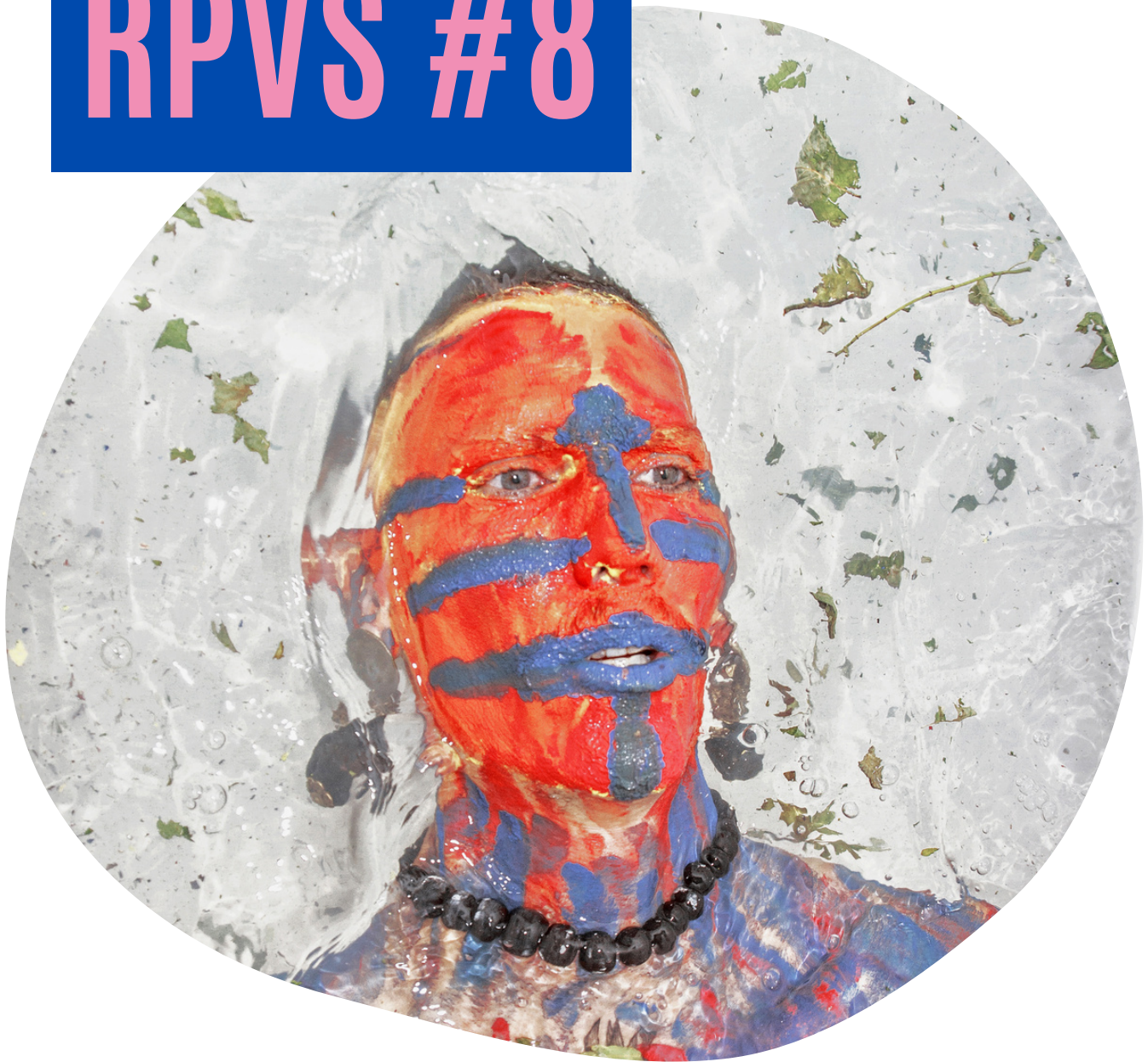
© Jeremias Escudero, De agua, 2020