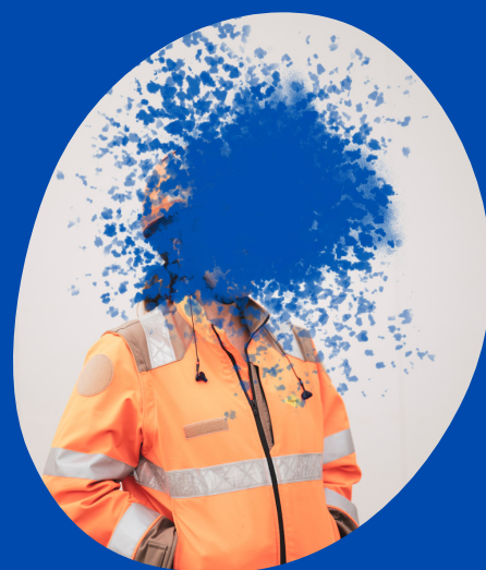
© Alessia Follo, Un jour sans fin, 2020

Depuis l'automne 2021, les Rencontres photographiques de ViaSilva investissent le quartier tout au long de l'année avec une programmation en OFF qui s'ajoute aux résidences.