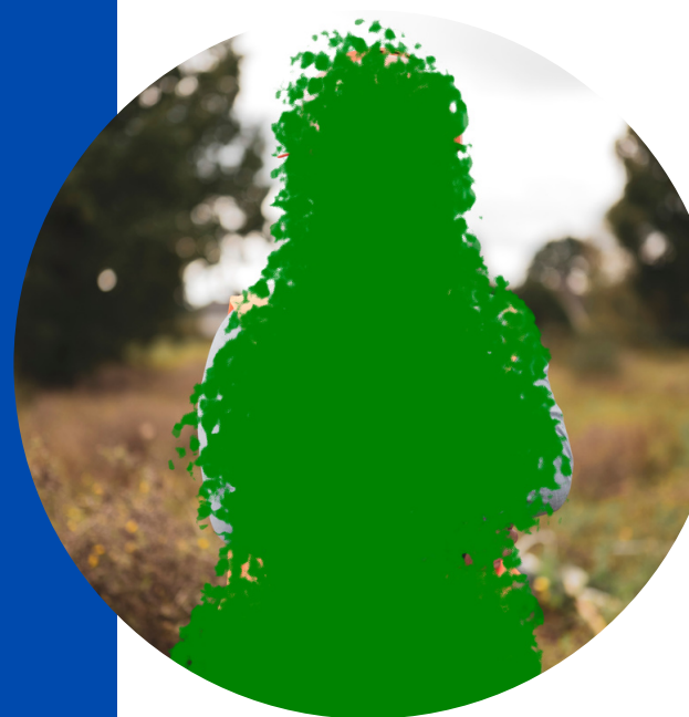
© Alessia Rollo, Un jour sans fin, 2021

→ S'inscrire dans un projet artistique à long terme en tenant compte des projets des artistes déjà réalisés lors des années précédentes.