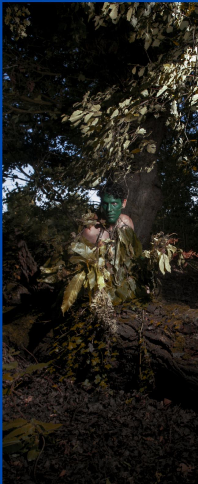
© Jeremias Escudero, De agua, 2020

→ SAISON HIVERNALE : la saison hivernale a été peu exploitée jusqu'ici par les résidences précédentes. Or, l'hiver, et par extension la baisse de température, modifie profondément les rapports sociaux.