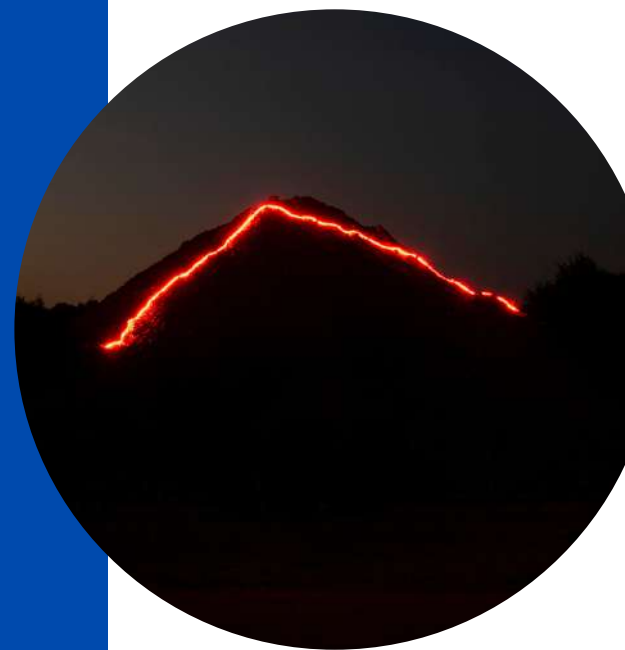
© Alessia Rollo, Un jour sans fin, 2020

→ S'inscrire dans un projet artistique à long terme en tenant compte des projets des artistes déjà réalisés lors des années précédentes.