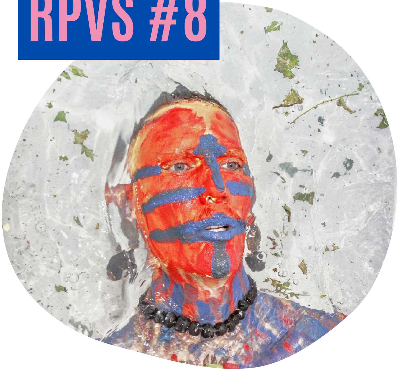
© Jeremias Escudero, De agua, 2020