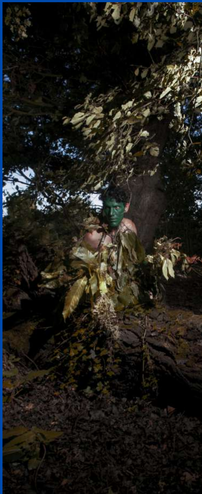
© Jeremias Escudero, De agua, 2020

→ SAISON HIVERNALE : la saison hivernale a été peu exploitée jusqu'ici par les résidences précédentes. Or, l'hiver, et par extension la baisse de température, modifie profondément les rapports sociaux.