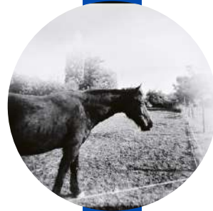
Trajectoire, 2017

Depuis l'existence de cet événement, plus de dix artistes — dont sept rennais·es — ont eu l'opportunité de présenter leur projet artistique sur ce quartier en mutation. Dès lors, de multiples artistes se sont côtoyé·es et succédé·es dans cette aventure humaine et artistique.