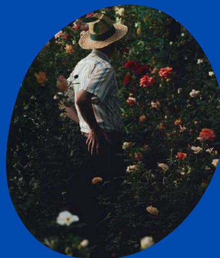
© Alessia Follo, Un jour sans fin, 2020

Depuis l'automne 2021, les Rencontres photographiques de ViaSilva investissent le quartier tout au long de l'année avec une programmation en OFF qui s'ajoute aux résidences.