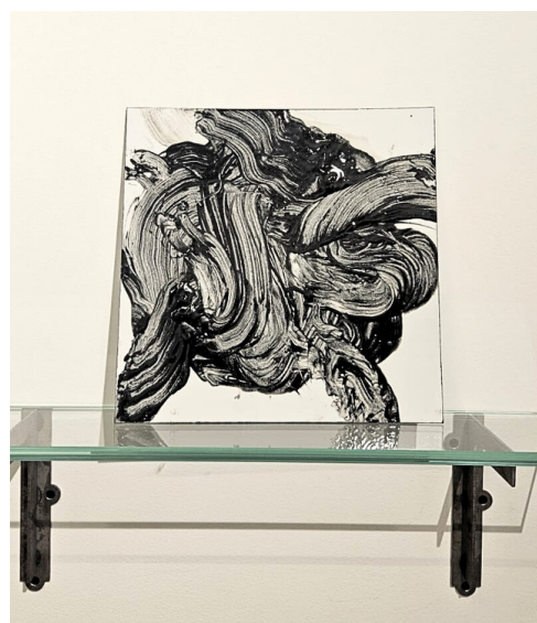
Photos issues de l'exposition Faire, Refaire, Galerie Net Plus, 2024