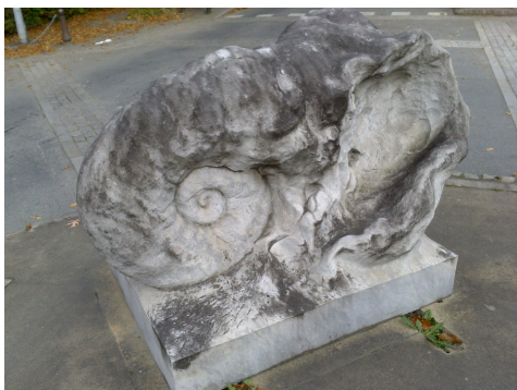
Janus , 1987, béton et marbre gris poli

Dans les années 80, Peter Briggs enseigne aux Beaux-Arts de Rennes. En 1987, il obtient une commande publique de la Ville de Rennes pour une installation pérenne dans la métropole. Cinq sculptures en béton et marbre gris poli forment l'ensemble Janus , installées à l'entrée à la porte de Bréquigny, rue de Nantes. Six autres œuvres en bronze, initialement mises au même endroit, ont été déplacées dans le parc Oberthur, pour des raisons de sécurité. Elles forment aujourd'hui un circuit autour du bassin du jardin.