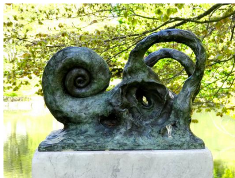
Janus 2 , 2014, bronze, marbre de Bardiglio

Ces sculptures ont une forme ressemblante à des coquillages et des crustacés, leur forme circulaire en spirale rappelle le rond point où elles se trouvent. Elles portent le nom du dieu romain Janus, gardien des passages, divinité des transitions et du changement. Il a deux visages : l'un regarde devant et l'autre derrière. Il est associé au mois de janvier.