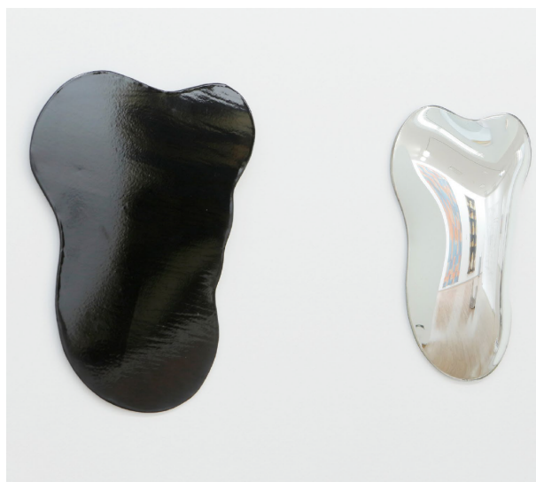
Shield , 2001-2003, acier émaillé, verre thermoformé argenté,