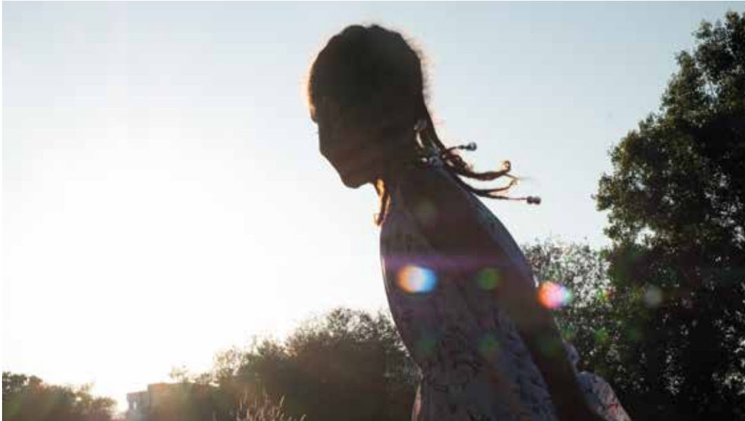
48° Nord, Isabelle VAILLANT - 2024

La galerie Net Plus vous propose de visiter l'exposition 48° NORD d'Isabelle Vaillant avec une médiatriceur-ice qui vous présentera plus en détail le travail de l'artiste et son inscription dans l'histoire de l'art contemporain.