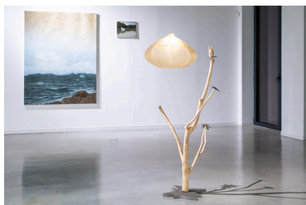
Exposition PNEUMA, Galerie Net Plus, © Stéphane Mahé