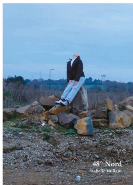
Couverture de 48° Nord, Isabelle Vaillant, Les Éditions de Juillet, 2024

Les contrats d'exposition et de résidence conclus entre l'association Les ailes de Caïus et les artiste-s sélectionné-es stipulent les obligations des parties, les moyens matériels et financiers proposés et les conditions de diffusion du travail.