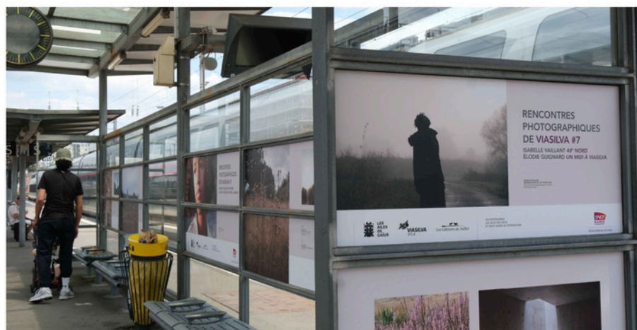
Supports imprimés des RPVS #7, Gare de Rennes

D'autres sites d'exposition pourront être envisagés à l'échelle de la métropole et de la région , tels que le parc du Thabor ou la station de métro Sainte-Anne à Rennes, ainsi que certaines gares de Bretagne. Ces sites seront déterminés en fonction des partenariats, mécènes et financements publics de 2025 et 2026.