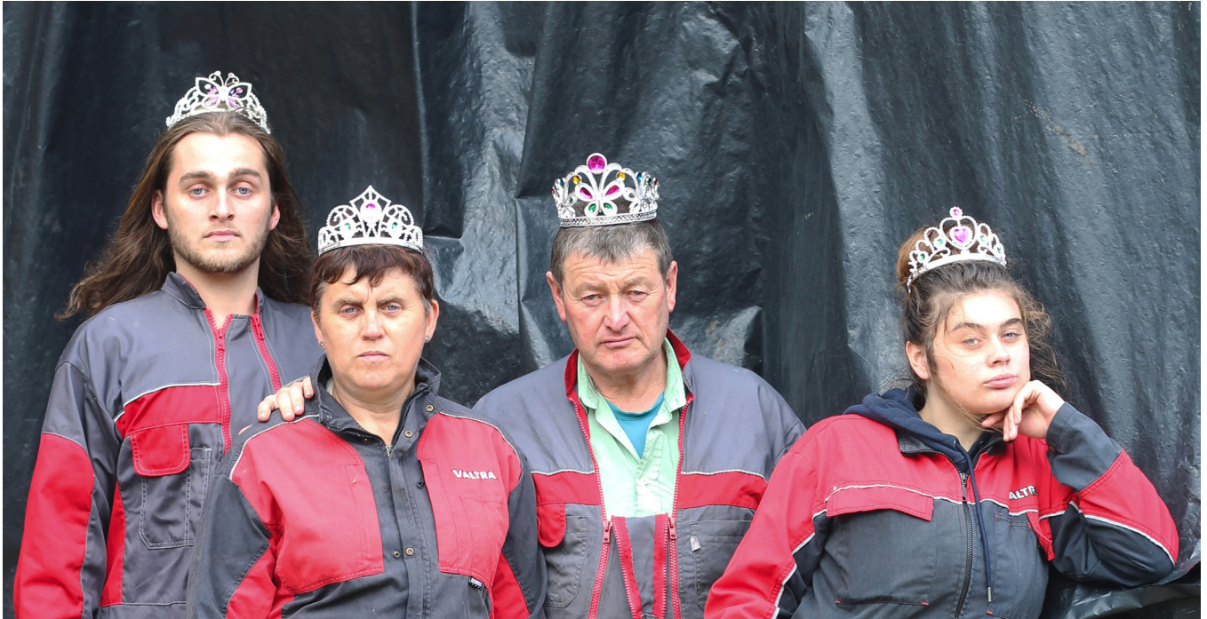
Portrait royal, Damien Rouxel, 2019, @Adagp Paris