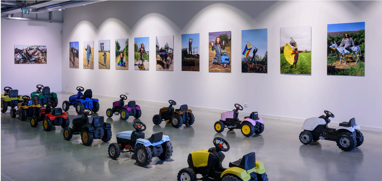
Photographie de l'exposition Des paillettes dans le fumier de Damien Rouxel, 2025