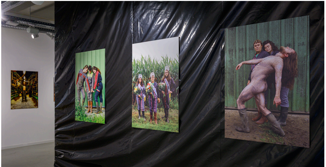
Photographie de l'exposition Des paillettes dans le fumier de Damien Rouxel, 2025

DURÉE : flexible (1h, 2h ou 3h selon format TD/CM)