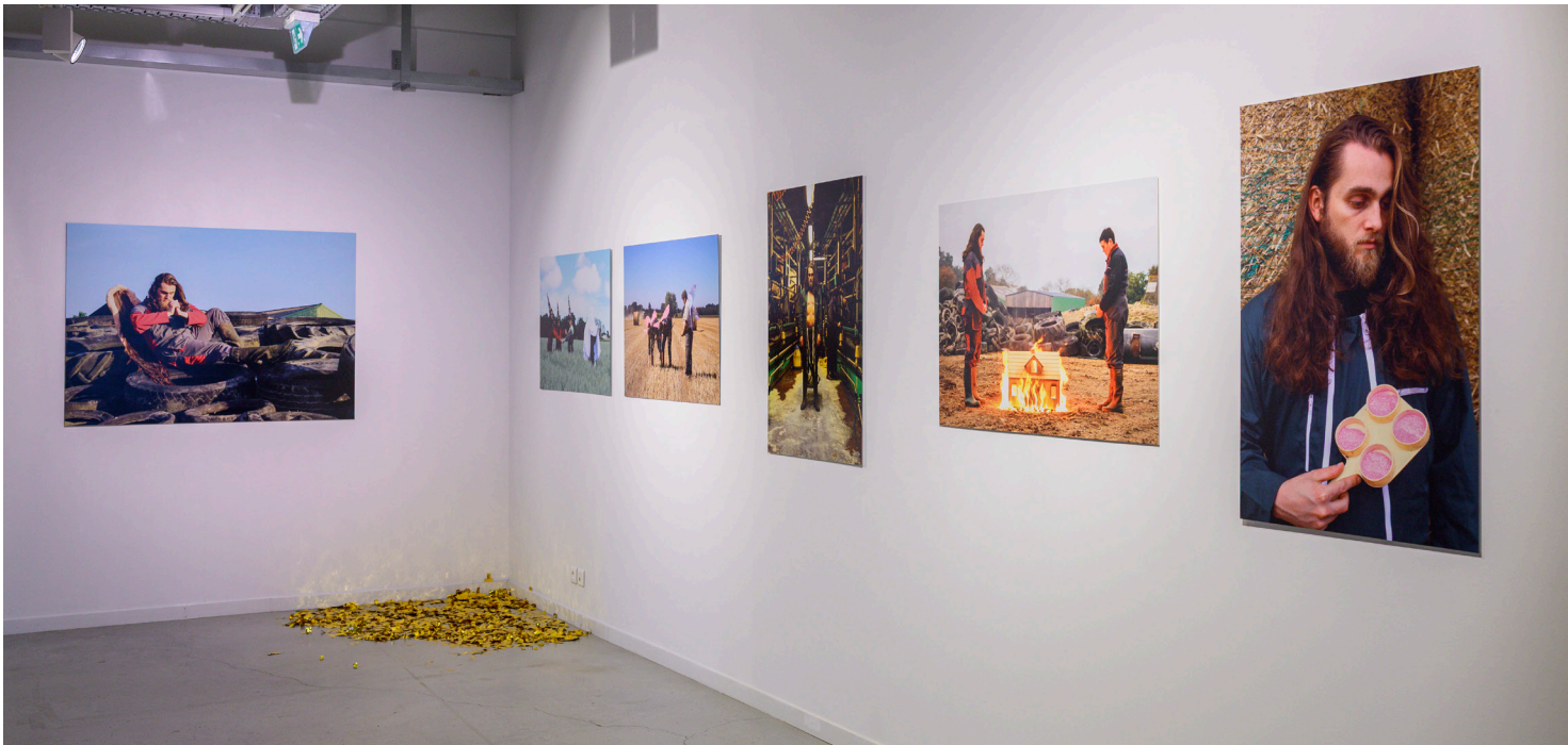
Photographie de l'exposition Des paillettes dans le fumier de Damien Rouxel, 2025